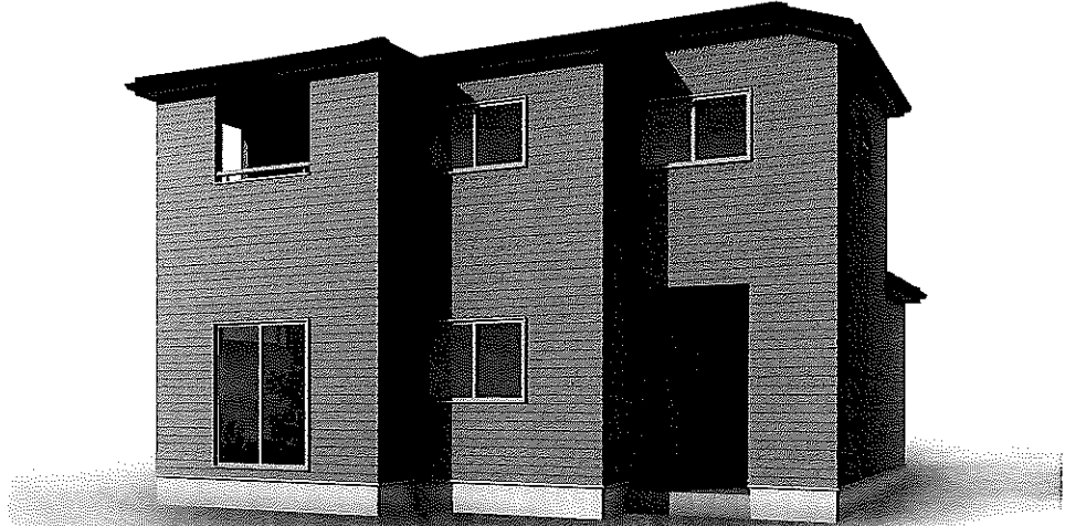
瀬戸内市邑久町尾張第5 1号棟